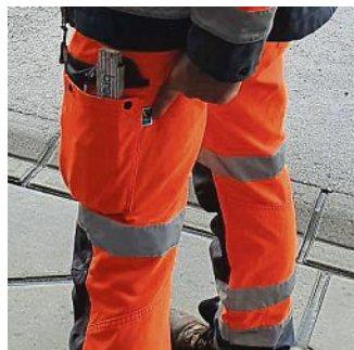
Praktisch, gut und fair: So sieht die neue Fairtrade-Arbeitskleidung des Puchheimer Bauhofes aus.