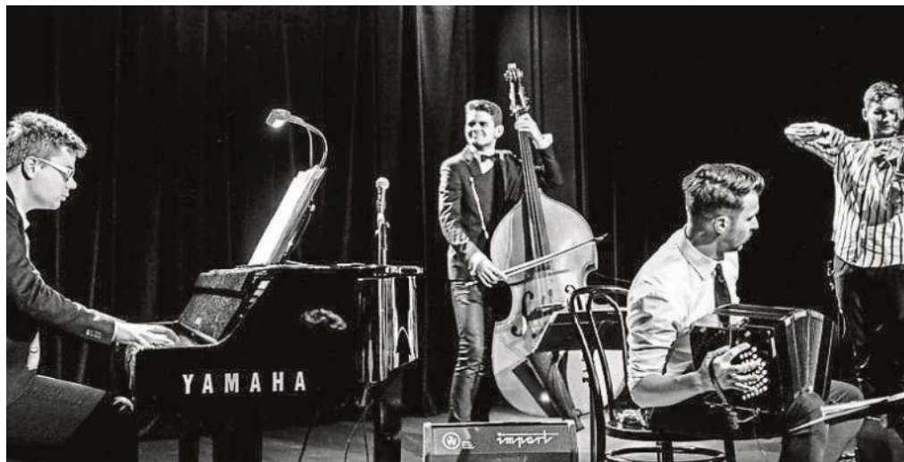
Ein getanztes Konzert mit Bandonegro gibt es am 24. Oktober.

Diese Veranstaltung muss leider entfallen. Bereits gekaufte Karten können im Kultur-